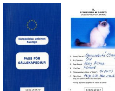
EU-pass för katter.