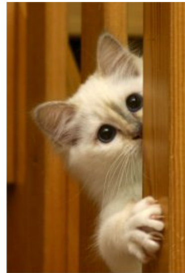
S*Rönngårdens Fireze, SBI j

Det är viktigt att ställa sig på samma nivå som katten är. Annars är det lätt att man förstör proportionerna på bilden. Tar du t.ex. bilden uppifrån så blir näsan lång och benen korta. Se också till att omgivningen är fri från stolar, blommor och annat som kan se ut som om de växer upp från kattens huvud eller rygg. Med dagens bildprogram i din PC kan du trots allt justera många av dem men det kräver bra kunskap för att lyckas. Detsamma gäller färger – en röd kudde drar uppmärksamheten från katten.