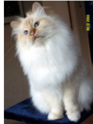
GIC Shenandoahs La Rioja Alta Ägare: Lena Nordström

Hur får man fram alla dessa fantastiska djurbilder? Många gånger har man undrat hur gör de egentligen? Här försöker vi samla lite tips för dig som har en ängels tålmod för det är nog det första man måste se till att man har. När man fotograferar människor använder man sig av stayling för att få dem bra på bilderna men för oss som vill fotografera katter gäller det att plocka fram kattens själ i rätt ögonblick. Många av våra bästa bilder är ofta ett ögonblicks verk. När man tittar i klubbarnas kattidningar, hos veterinärerna etc. så ger de flesta bilder inte katterna full rättvisa.